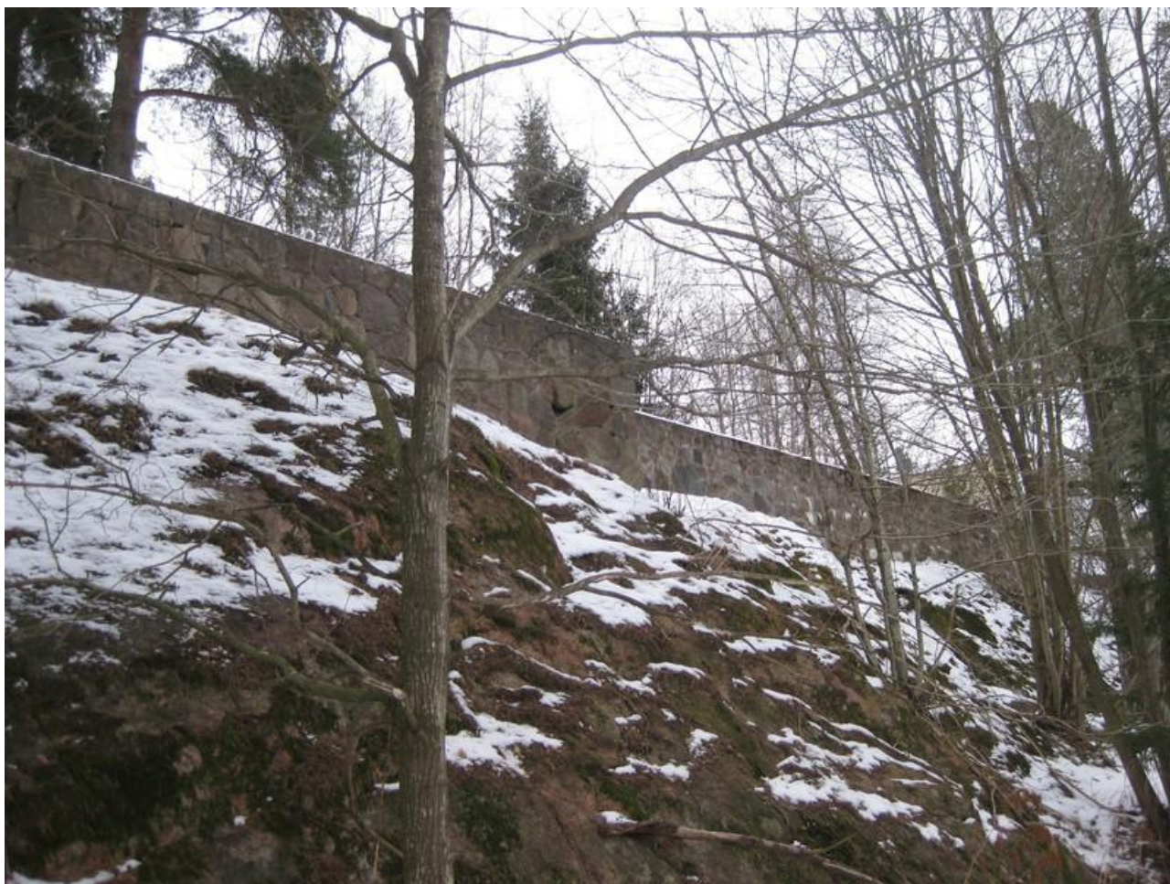
(Bild 6) Mur vid sommarstugeterrasserna vid Vårgård. Foto: Joakim Johansson, 2011