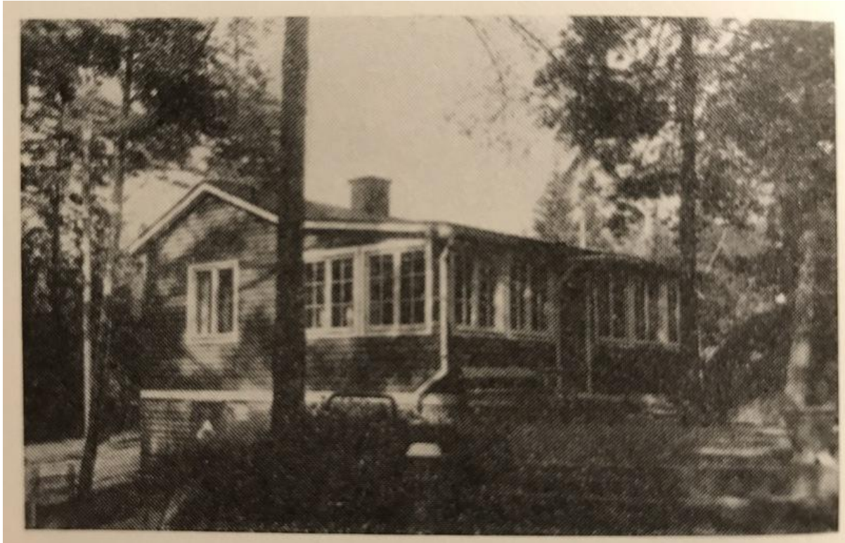
(Bild 10) Berglid på västra tomten. Bild ur boken "Sveriges bebyggelse - Östergötland" del III, 1950.

Bild 5. Åby 4 7 , Berglid, Hackefors: 600 m. fr. jvst. 3.005 kvm. Tax. 3.000 (1.000, 2.000). Förvärvad 1935. Trä, 1935, 1 rum, 1 kök. El. — Tygverkmäst. Nils o. Ingrid Lindberg, Linköping.