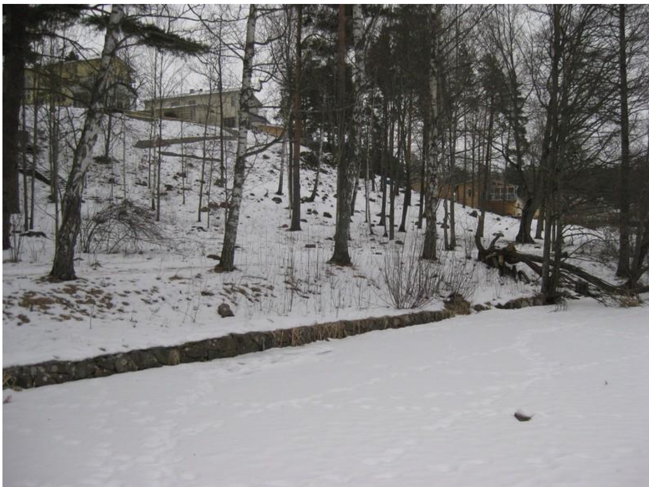
(Bild 2) Stensatta kanter vid Stångån vid Vårgård.