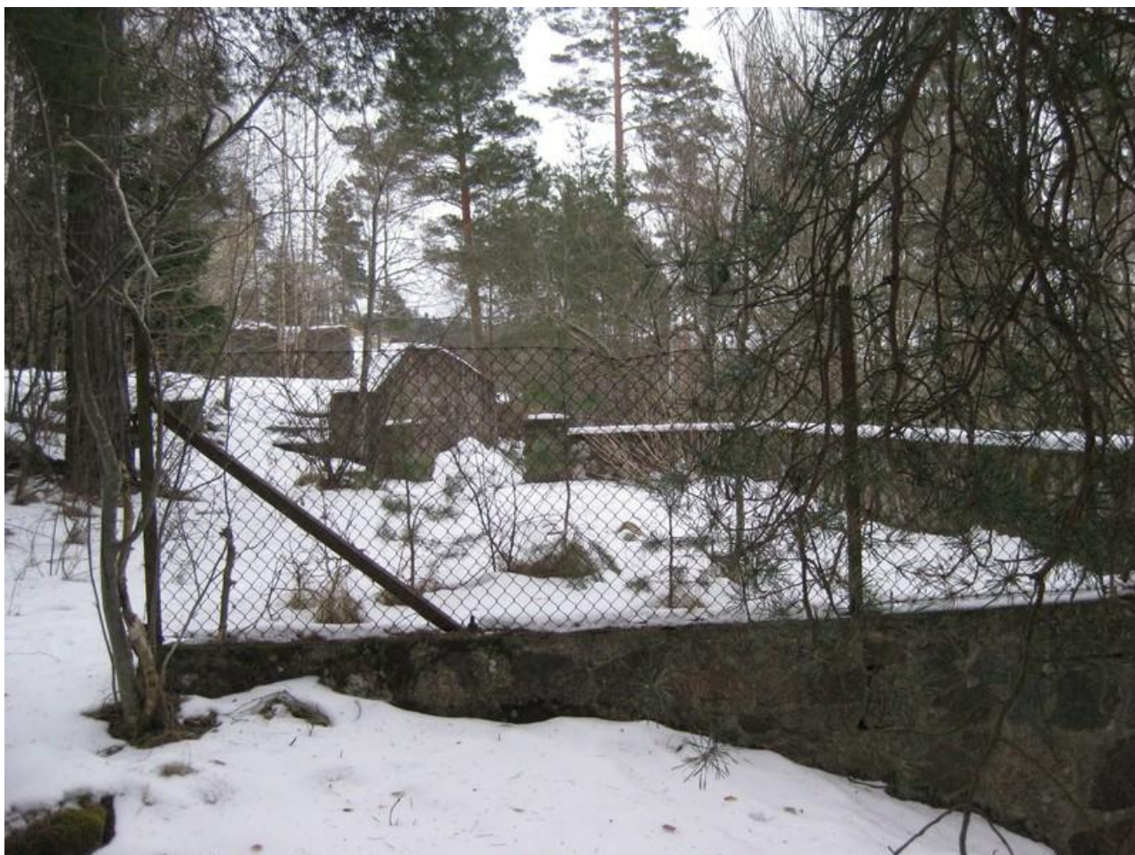
(Bild 7) Sommarstugeterrasserna vid Vårgård. Foto: Joakim Johansson, 2011

Efter att jag, imponerad av omfattningen, klivit omkring bland de övervuxna stensatta gångarna, och mossbeklädda trapporna så begav jag mig hem för att söka mer information via kartor och fastighetsförteckningar.