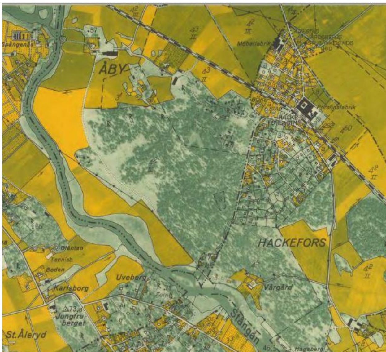
(Bild 9) De två långsmala avstyckade sommarstugetomterna syns till vänster om Vårgård. Del av ekonomiska kartan (8F4i) 1947