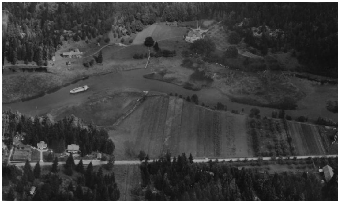
(Bild 8) Flygfoto över Vårgård 1931 med Hjulsbrovägen (idag Uvebergsvägen) i nederkant. På kanalen syns motorlastfartyget REX av Linköping. Sommarstugetomterna fanns ännu inte vid fototillfället, men skulle komma att anläggas bland granarna i bildens vänstra övre hörn.

Den västra gränsen för området Vårgård är även gränsen mellan Landeryd och Vårdsberg socknar. Marken på västra sidan, Vårdsbergssidan, tillhörde gården Åby som ligger nära Spångerumsbron (byggd 2000), ett stycke åt nordväst. Vid den aktuella platsen avstyckades så sent som 1935 två långsträckta tomter där den östra fick beteckningen Åby 4 6 och den västra Åby 4 7 .