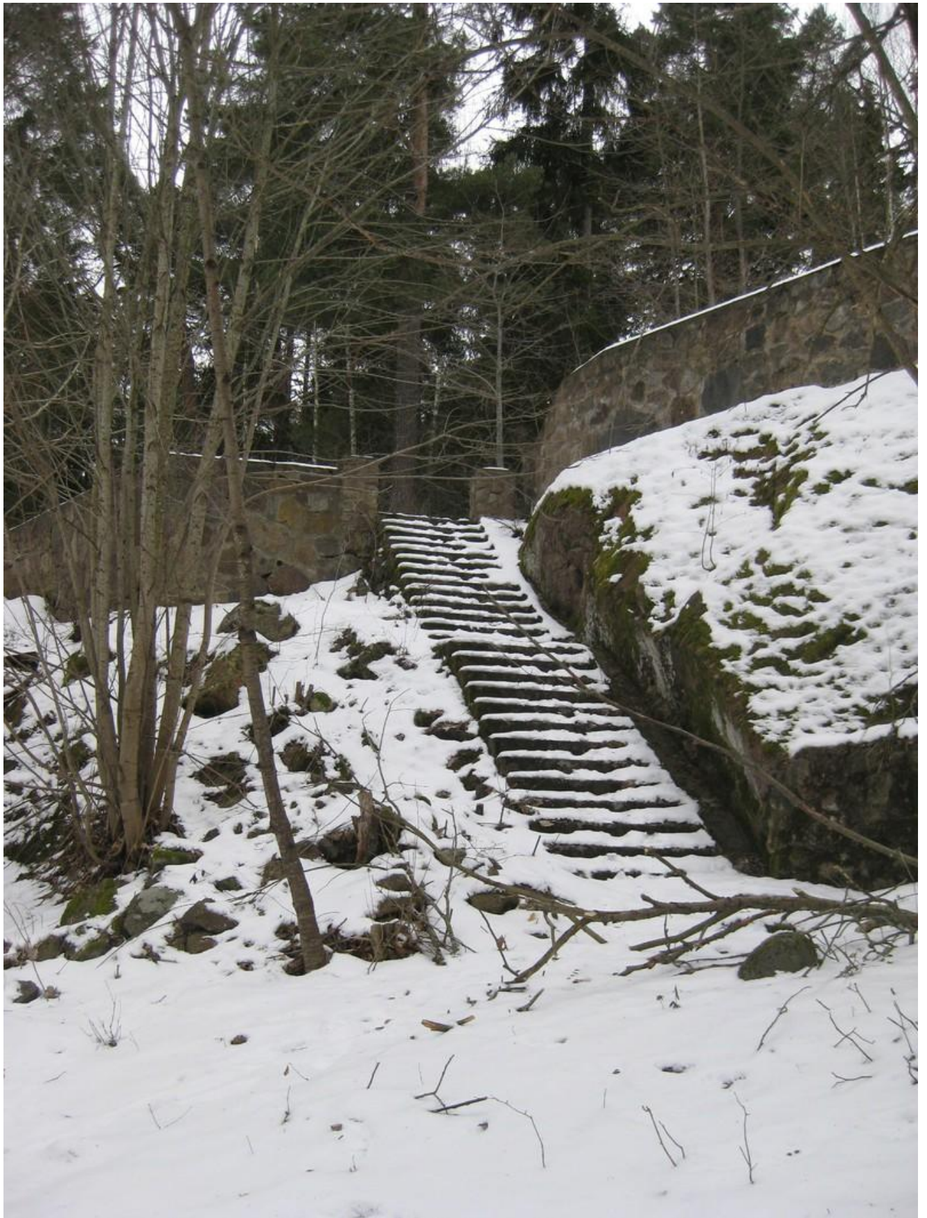
(Bild 5) Trappa insprängd i berget vid Vårgård. Foto: Joakim Johansson, 2011