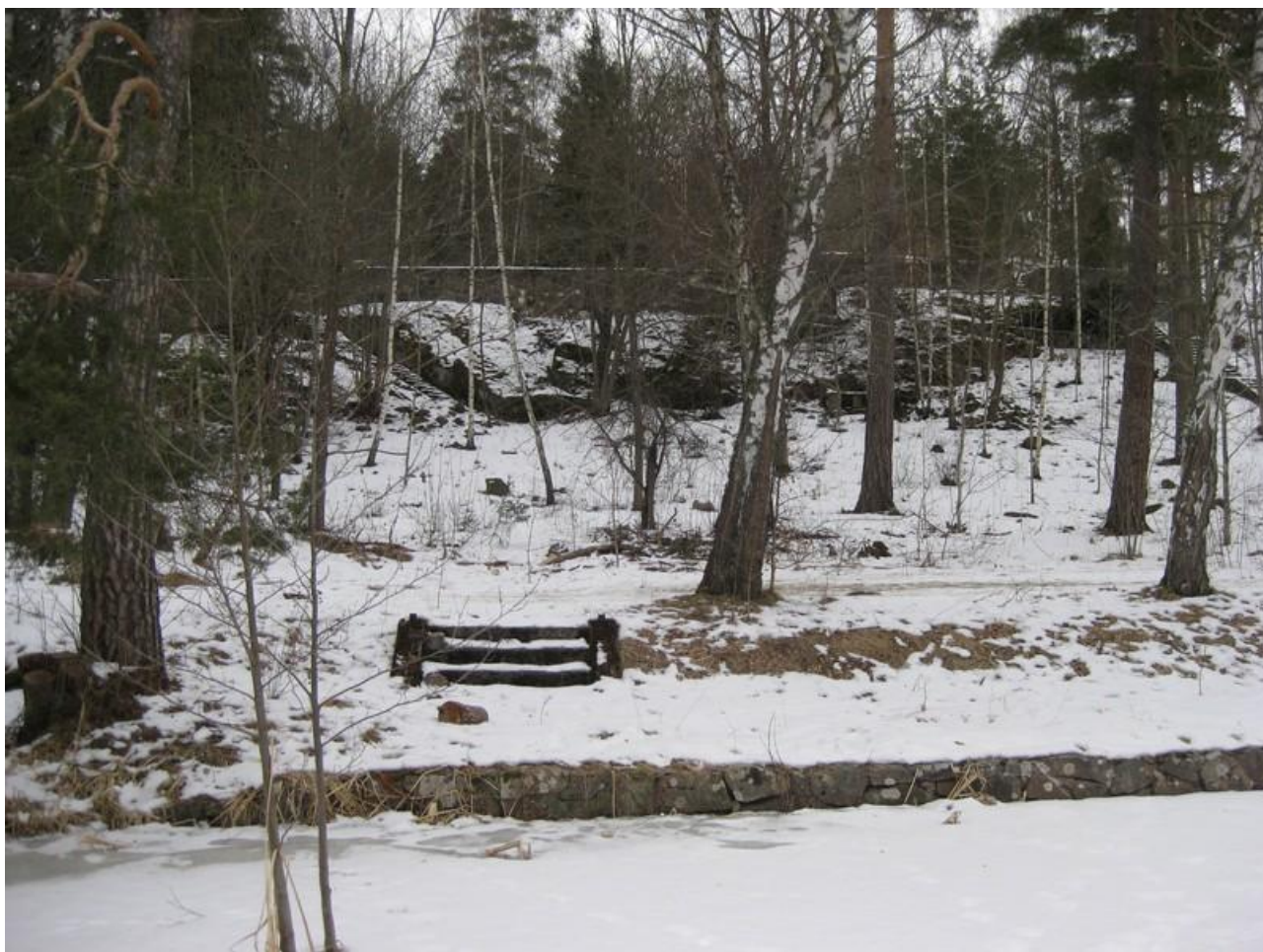
(Bild 3) Stensatta kanter vid Stångån med terasserna i bakgrunden vid Vårgård.