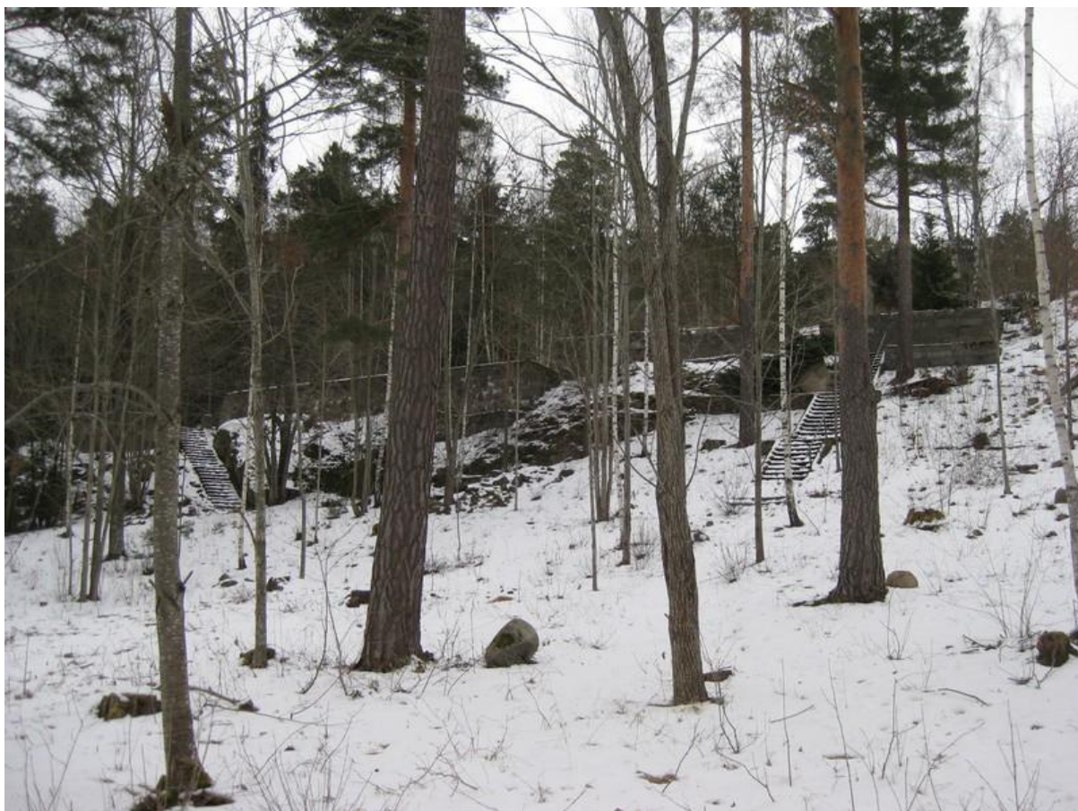
(Bild 4) sommarstugeterrasserna vid Vårgård. Foto: Joakim Johansson, 2011