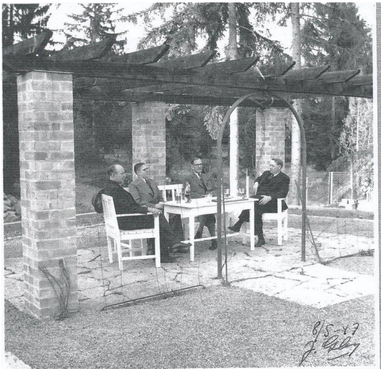
(Bild 15) Foto från trädgårdarna 8 maj 1947.