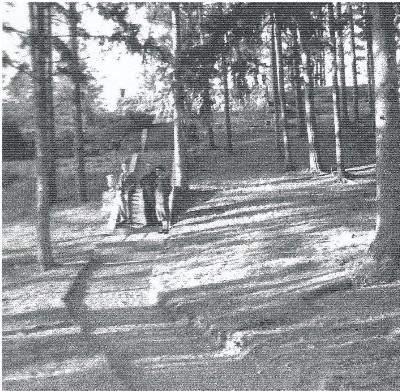
(Bild 16) Foto från trädgårdarna 8 maj 1947. (Privat foto, papperskopia, inlånad till Landeryds hembygdsförenings arkiv)