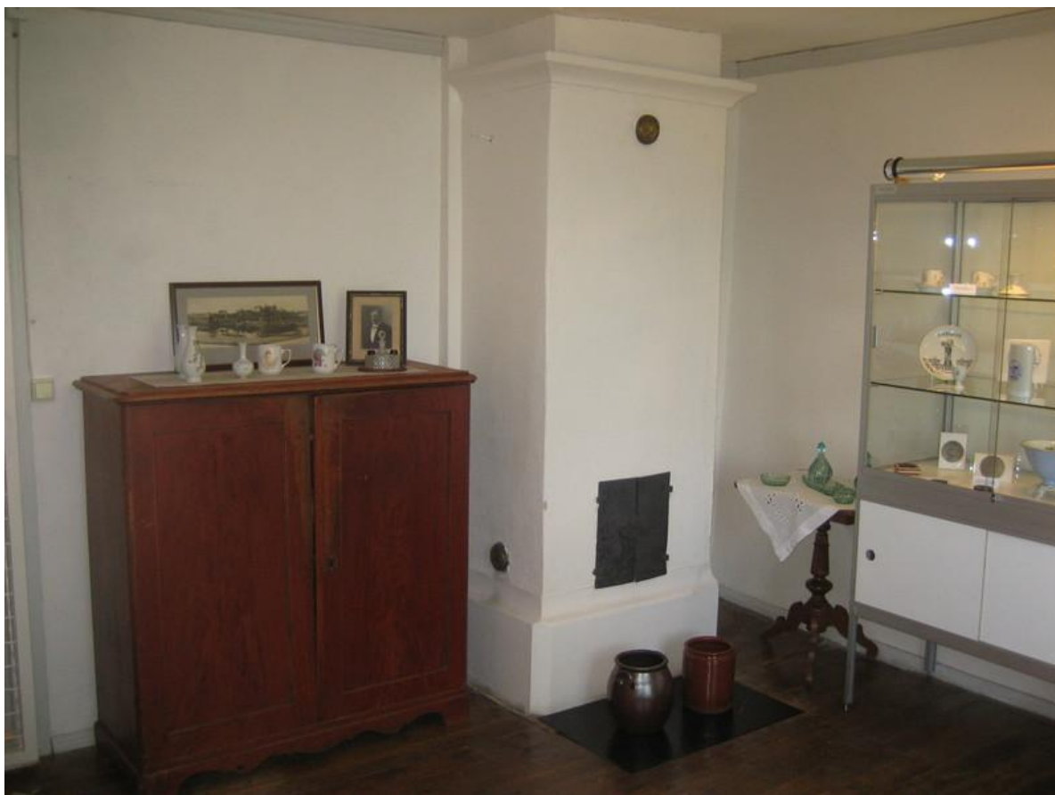
Rörspisen på andra våningen. Foto: Joakim Johansson 2006

Vid något tillfälle har en kammare byggts på ovanvåningen intill köket med en lucka eller fönsterglugg under takfoten. Omkring 1937 förbättrades bostaden genom att ett trapphus byggdes till och den invändiga trappan från bottenvåningen sattes igen. En större frontespis byggdes med två stora fönster mot väster, vilka gav mer ljus i köket och kammaren. Längs rummets sidor finns så kallade kattvindar. I båda kattvindarnas förlängning finns halvmånefönster på södra gaveln.