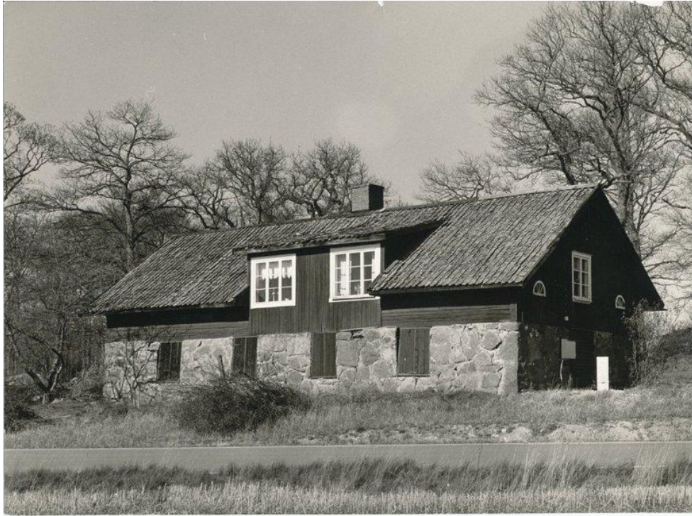
Smedjan vid Harvestad före hembygdsföreningens övertagande. I nederkant av bilden syns den nyanlagda vägen till Landeryds golfklubb. Ovanför den asfalterade vägen, närmare Smedjan, går föregångaren, en äldre grusväg. Foto: Ivan Gustavsson omkring 1990 (Landeryds hembygdsförening)