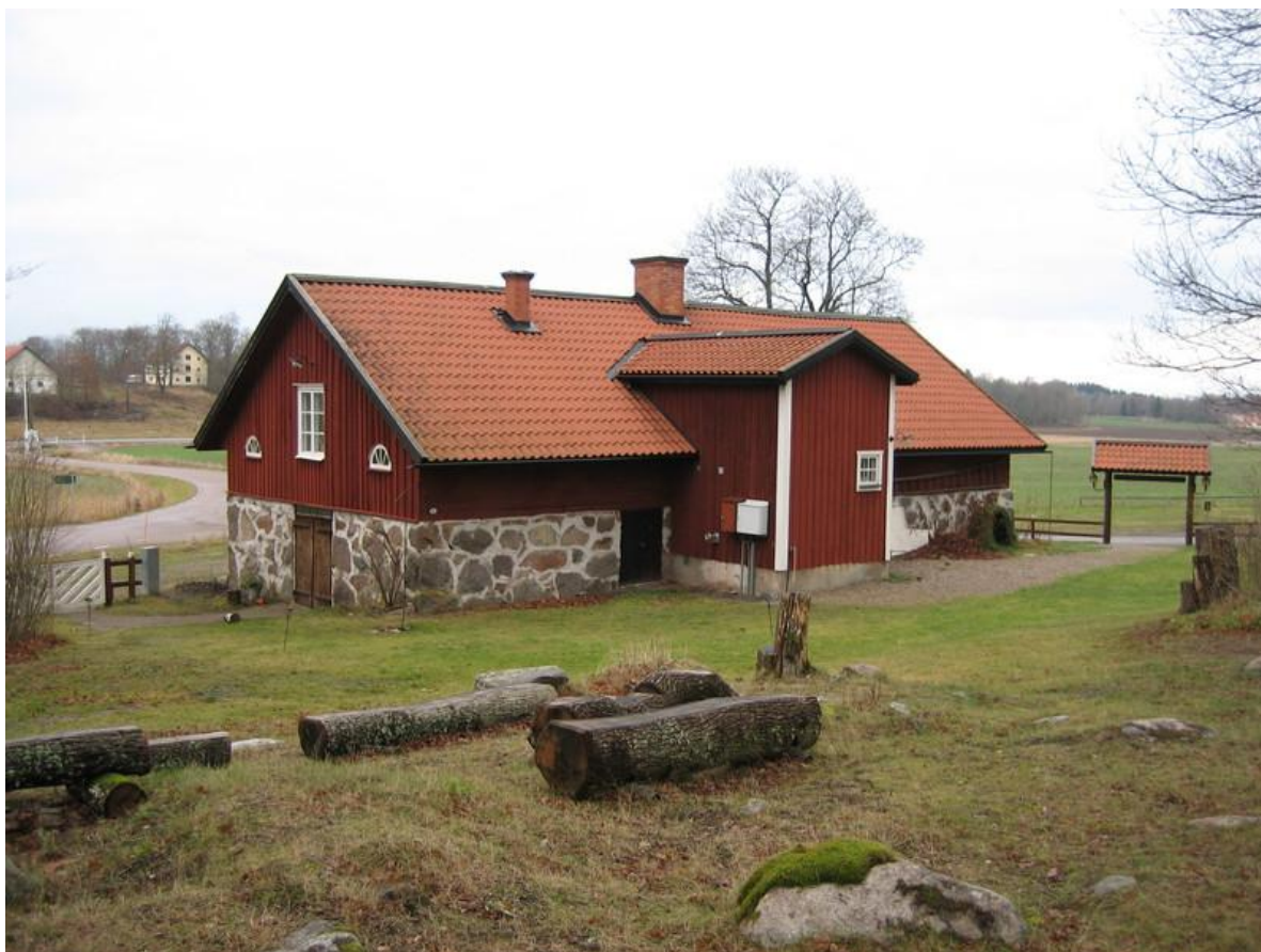
Smedjan vid Harvestad. Trapphuset byggdes 1937 och ersatte en invändig trapp. Foto: Joakim Johansson 2006