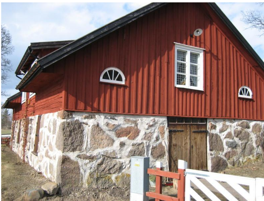
Smedjan vid Harvestad.