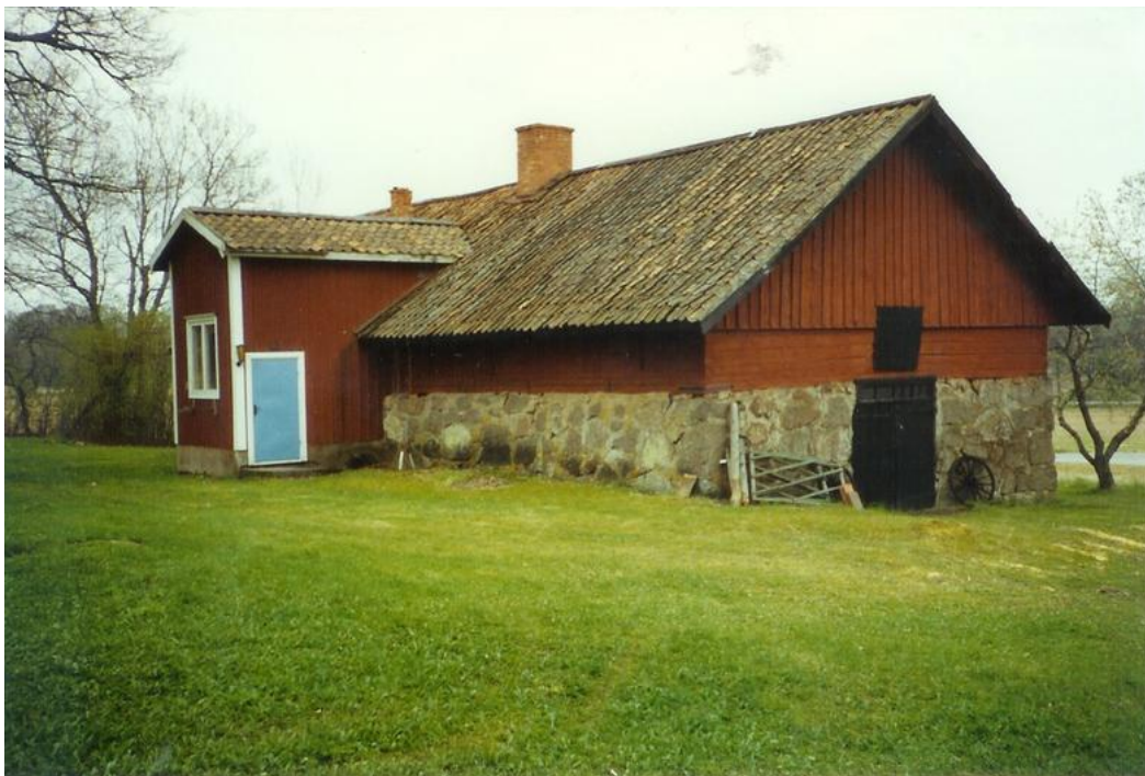
Smedjan före renovering.