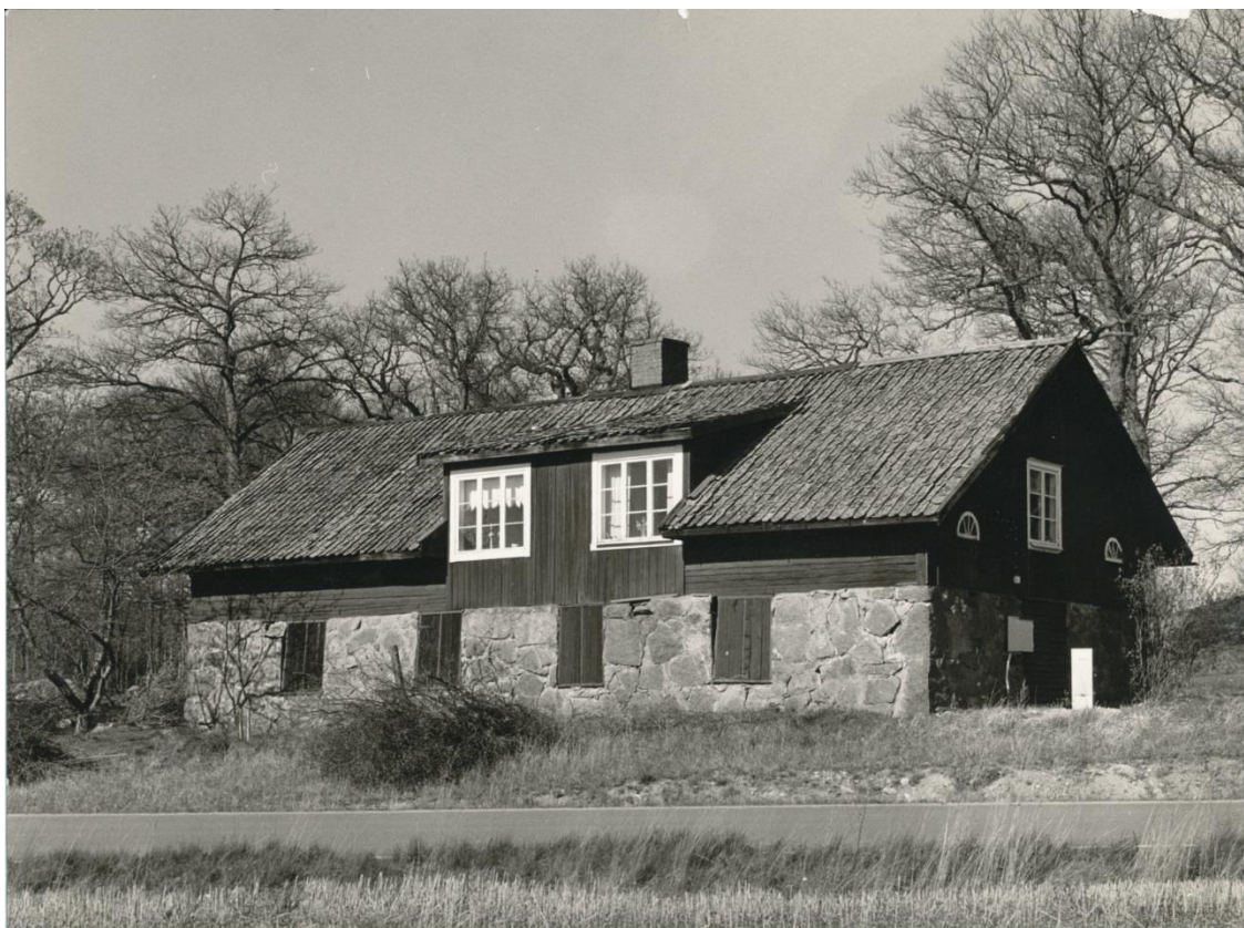
(Bild 1) Smedjan vid Harvestad före hembygdsvöreningens övertagande. I nederkant av bilden syns den nyanlagda vägen till Landeryds golfklubb. Ovanför den asfalterade vägen, närmare Smedjan, går föregångaren, en äldre grusväg. Foto: Ivan Gustavsson omkring 1990 (Landeryds hembygdsvörening)