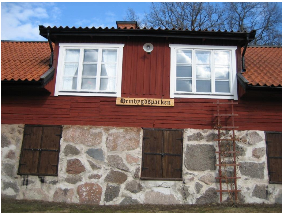
(Bild 10) Under det vänstra fönstret syns den igensatta gluggen som var ljusinsläpp till kammaren innanför. Foto: Joakim Johansson 2006

Vid något tillfälle har en kammare byggts på ovanvåningen intill köket med en lucka eller fönsterglugg under takfoten. Omkring 1937 förbättrades bostaden genom att ett trapphus byggdes till och den invändiga trappan från bottenvåningen sattes igen. En större frontespis byggdes med två stora fönster mot väster, vilka gav mer ljus i köket och kammaren. Längs rummets sidor finns så kallade kattvindar. I båda kattvindarnas förlängning finns halvmånefönster på södra gaveln.