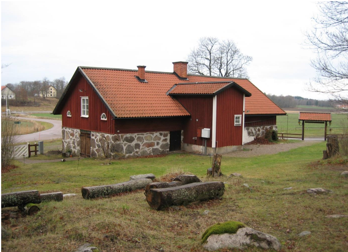
(Bild 8) Smedjan vid Harvestad. Trapphuset byggdes 1937 och ersatte en invändig trapp.

Föreningsmedlemmar har genom åren spekulerat i alla möjliga användningsområden för byggnaden. Allt från att det kunde ha varit ett kloster på 1300-talet då Bo Jonsson Grip var gårdens ägare till att det varit salpetersjuderi på 1600-talet, det vill säga en del i kruttillverkning. Att det varit ett kloster är uteslutet av flera skäl, medan teorin om salpetersjuderi eller krutförråd kan vara mer trolig. En eller flera gårdar i Harvestad tillhörde nämligen Kronan fram till och med 1700-talet. Men några personer med titeln salpetersjudare eller likande har hittills inte påträffats vid Harvestad i kyrkoarkiven.