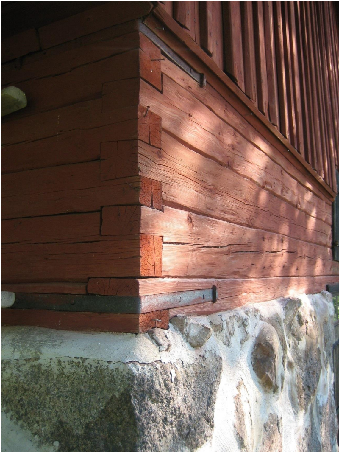
(Bild 11) Detalj av Smedjan vid Harvestad. Foto: Joakim Johansson 2006