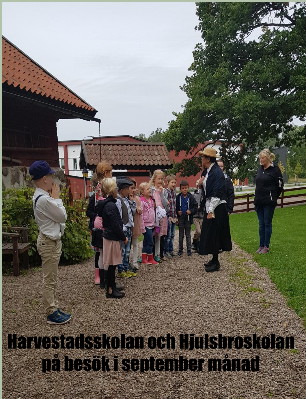
Harvestadsskolan och Hjulsbroskolan på besök i september månad