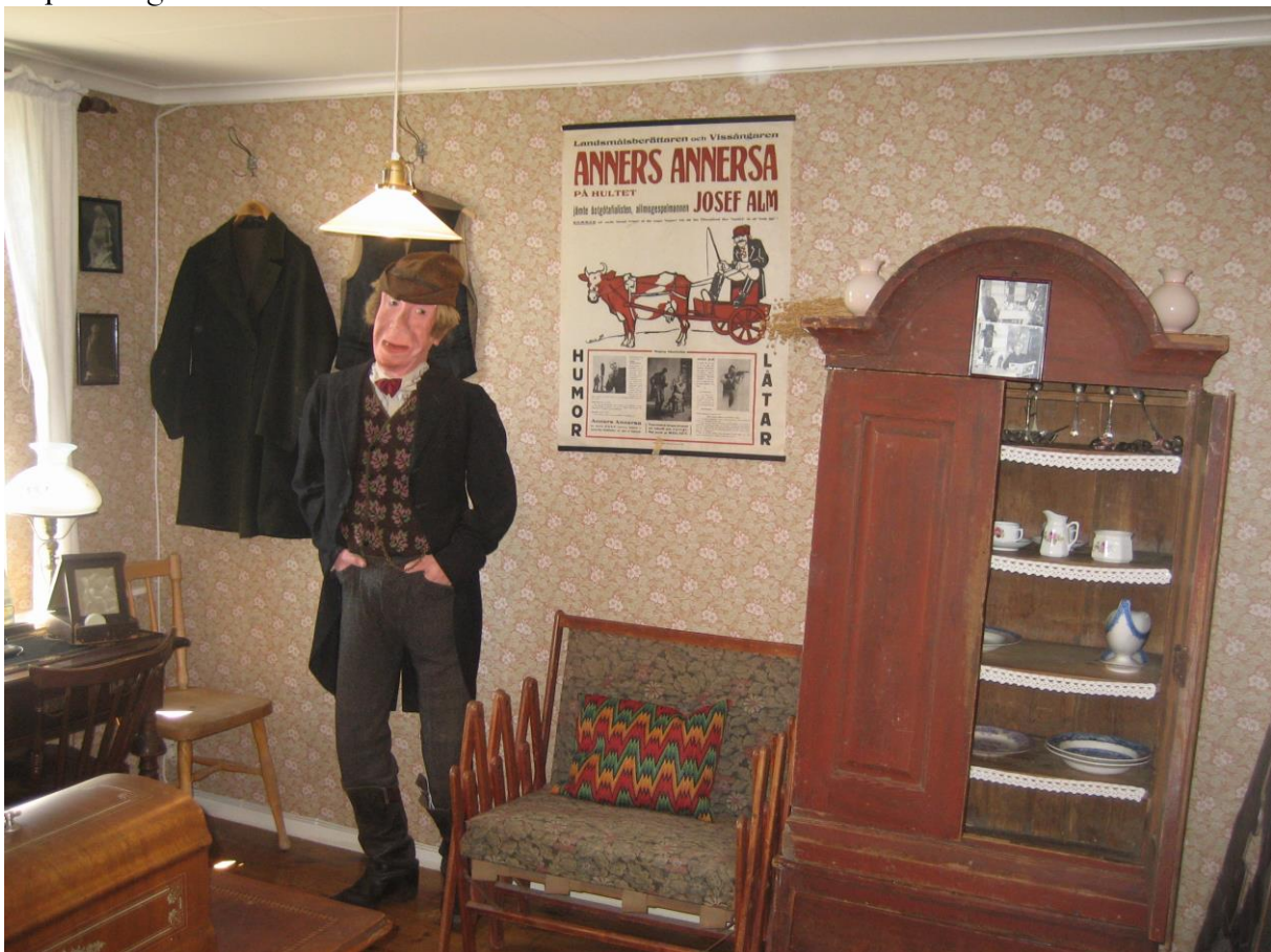
Museet om Anners Annersa på Hultet.

Smällpiskerocken härstammar från en auktion efter en granne som hade den som kyrkrock. Till kostymen hör också den gamla bondmössan av vadmal med insytt hår och löspolisongerna samt fickuret.