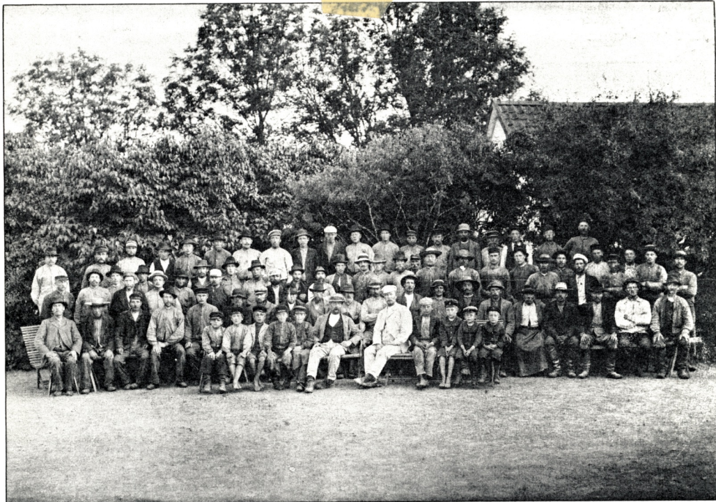
En del av arbetsstyrkan vid Ekholmens huvudgård år 1903. Under det året byggdes de flesta av de egnahemmen. Samtidigt brukades huvudgården för att ge egnahemsföreningen pengar. Med bland de församlade arbetarna finns både lantarbetare och hantverkare som sysslade med byggnationen. Flera av dem köpte sig en bostad när arbetet stod klart.