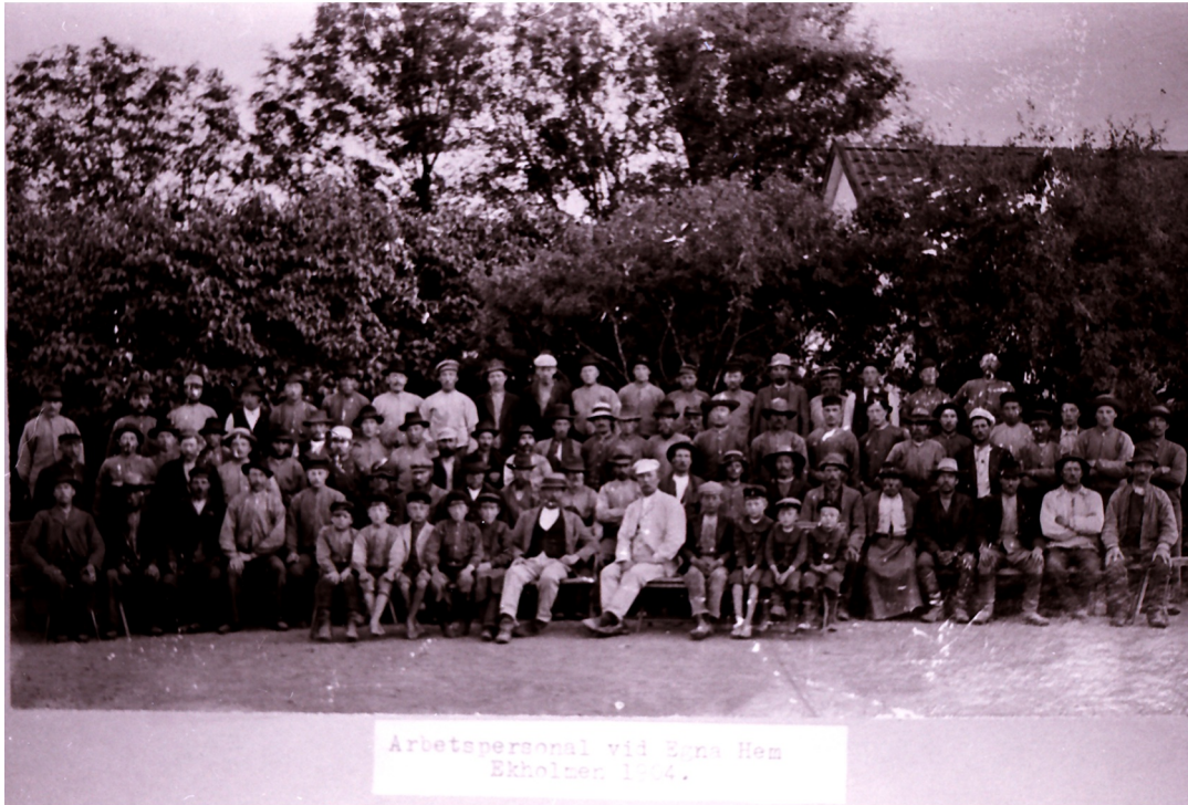
Arbetspersonal vid Egna Hem Ekholmen 1934.