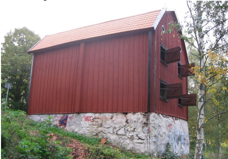
Bild 3. Blästad magasin med fönsterluckorna. Bakom panelen på långsidorna finns fler igensatta fönsterhål.

Ingen annan släktkoppling har hittats, så den romantiska berättelsen om att inte kunna skiljas från sitt hus är därför sannolikt en skröna. Det senare även bevisat genom den dendrokronologiska undersökningen som gav ett senare årtal och som beskrivs längre ner i texten.