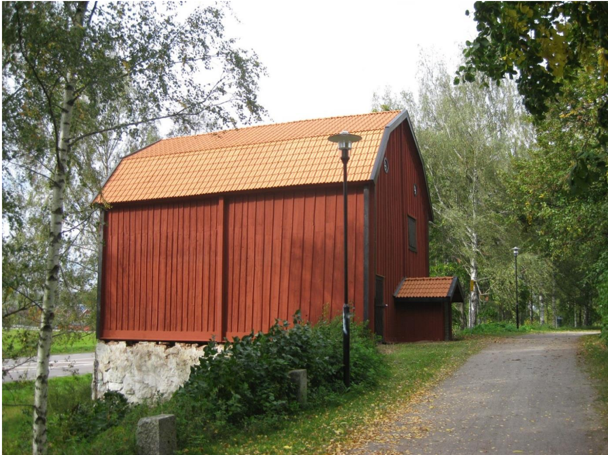
Bild 14. Magasinet ligger intill cykelvägen som är den ursprungliga sträckningen av Vistvägen.