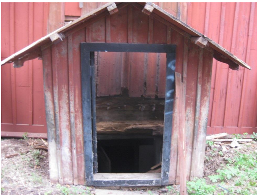
Bild 5. Reparation av källarnedgången med spår i magasinets panel efter en äldre lägre svale som varit inbyggd mot timmerstommen. Foto: Joakim Johansson, 2008.

I ett brandförsäkringsprotokoll från 1834 redovisas Blästad gårds samtliga byggnader och deras inbördes läge mycket noggrant 2 . Den röda mangårdsbyggnaden byggd 1812 noteras som No 1 i protokollet benämnd. "i 28 alnars afstånd från närmast belägne No 1... Spannmålsbod af Timmer i 3ne Våningar, rödfärgad under Tak af spån, 19 alnar lång, 14 Dito bred och 9 Dito hög i godt stånd utförd på 5½ alnars hög Stenfodt med en af Tegel hvälfd källare under med trädtrappa och 2ne Dörrar samt 2ne Lämmar till Svalan" Nere i källaren finns en yttre dörr och en dörr längre in i en mellanvägg, därav tvenne dörrar i protokollet. Överbygget över källartrappen är av senare karaktär, kanske 1900-tal. I panelen bakom överbygget syns spår efter en äldre lägre konstruktion över trappan, därav det som i protokollet kallas "2ne Lämmar till Svalan". Svale är en äldre benämning på just detta.