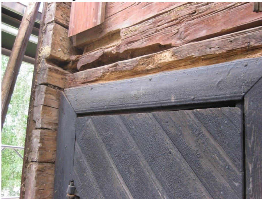
Bild 12. Timmerväggarna är rödfärgade utvändigt, men inte denna sida av knutarna. Foto: Joakim Johansson, 2008.

Att timmerstommen varit rödfärgad utvändigt visade sig vid lagning av panelbräderna 2008. Knutarna är inklädda med tjärade knutbräder. Vid byte av knutbräda visade det sig att insidan av knutarna inte var rödfärgade. Det skulle kunna betyda att huset var rödfärgat före flytten. En möjlighet är att när huset sedan kapades i längd, gaveln flyttades in och magasinet kläddes med panel så blev denna sida av knutarna aldrig målade, eftersom de tidigare varit insida på huset när stockarna var längre.