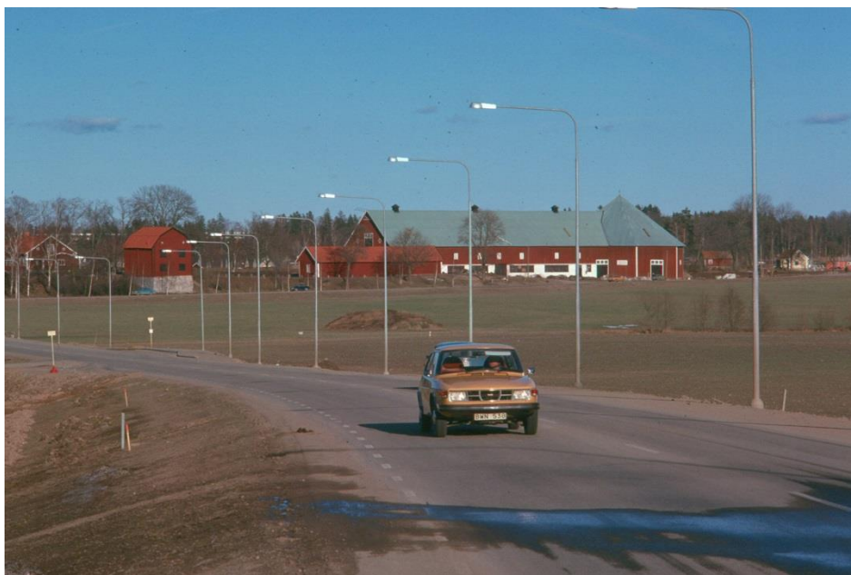
Bild 13. Blästad från Haningeleden. Foto: Hans hansson, våren 1977.

Att Blästad magasin är ett flyttat halvt boningshus från Kassingstorp känns trots några frågetecken självklart för mig. Att byggnaden uppfördes vid Kassingstorp 1788 är troligt, ytterligare dendro-undersökning kan säkerställa detta. Det svåraste har varit att få fram ett årtal när flytten skedde, dock avgränsat till perioden 1788-1818.