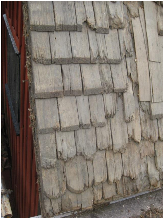
Bild 6. Under tegeltaket finns det gamla spåntaket bevarat. Tjocka spåner likt kyrkspån som bär spår av att ursprungligen ha varit rödtjärat. Foto: Joakim Johansson, 2008.