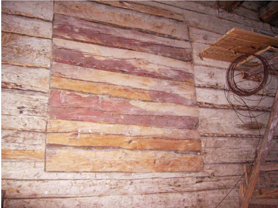
Bild 4. Ett av de igensatta fönsterhålen i magasinet. Foto: Torolf Nilzén, 2006.

I ett brandförsäkringsprotokoll från 1834 redovisas Blästad gårds samtliga byggnader och deras inbördes läge mycket noggrant 2 . Den röda mangårdsbyggnaden byggd 1812 noteras som No 1 i protokollet benämnd. "i 28 alnars afstånd från närmast belägne No 1... Spannmålsbod af Timmer i 3ne Våningar, rödfärgad under Tak af spån, 19 alnar lång, 14 Dito bred och 9 Dito hög i godt stånd utförd på 5½ alnars hög Stenfodt med en af Tegel hvälfd källare under med trädtrappa och 2ne Dörrar samt 2ne Lämmar till Svalan" Nere i källaren finns en yttre dörr och en dörr längre in i en mellanvägg, därav tvenne dörrar i protokollet. Överbygget över källartrappen är av senare karaktär, kanske 1900-tal. I panelen bakom överbygget syns spår efter en äldre lägre konstruktion över trappan, därav det som i protokollet kallas "2ne Lämmar till Svalan". Svale är en äldre benämning på just detta.