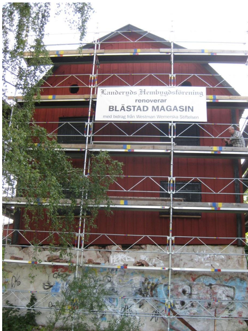
Bild 11. Landeryds hembyggsförening renoverar Blästad magasin med bidrag från Westman-Wernerska stiftelsen. Foto: Joakim Johansson, 2008.

Skulle byggnaden kunna ha uppförts direkt vid Blästad med det nyfällda stockarna 1788? Det är mycket osannolikt eftersom det inte funnits anledning till att ha mellanväggar med dörrar eller murstock i ett magasin. Tidigare nämnda detaljer talar alla för att det varit ett boningshus. Byggnaden antecknas som spannmålsbod vid Blästad i ett brandförsäkringsprotokoll från 1834 och källarvalvet under är för svagt för att bära en murstock. Sägner om flytten stämmer med byggnaden och stengrunden vid Kassingtorp. Det enda som talar emot en flytt är att ingen märkning har hittats på stockarna. De borde ha märkts vid nedmonteringen för att få hop detta stora pussel igen.