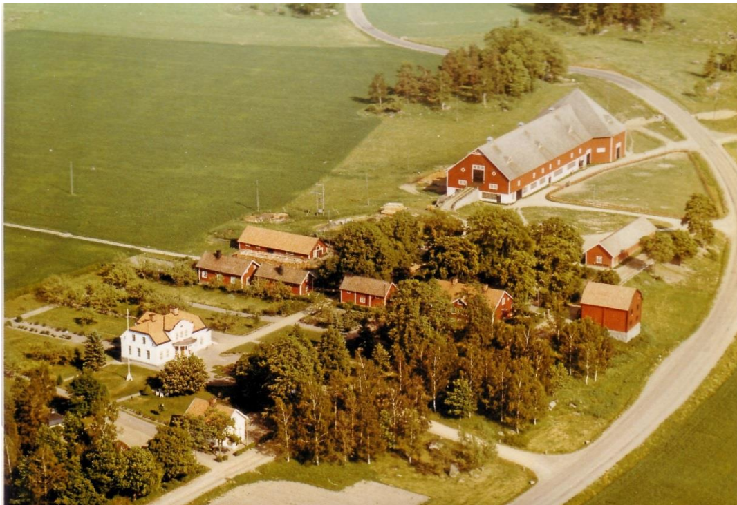
Bild 2. Blästad magasin till höger närmast Vistvägen. Till vänster om magasinet syns den äldre huvudbyggnaden från 1812. Den vita huvudbyggnaden uppfördes 1906. Den stora logen från 1917 brann ned 1992. Flygfoto 1960-70-tal

2007 övertogs magasinet av Landeryds hembygdsförening som genom ett stort bidrag från Westman-Wernerska stiftelsen i Linköping kunde rusta upp byggnaden.